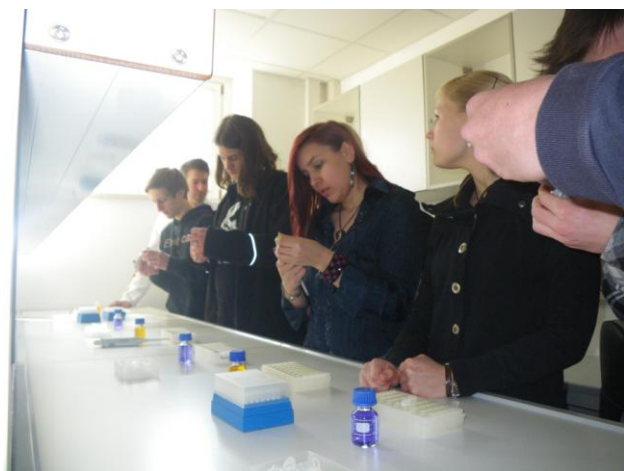
In den Laboren