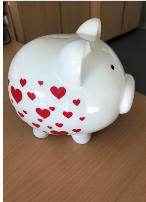
Das Spendenschwein sagt Danke!